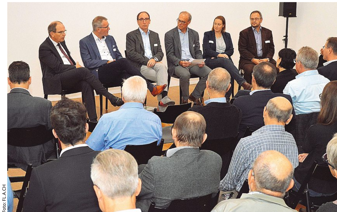
In Vaduz wurde am Samstag über das grenzüberschreitende Bahnprojekt „FL.A.CH“ diskutiert

Von einer raschen Realisierung ist man aber noch ein ganzes Stück entfernt. Differenzen gibt es etwa, was die unterschiedlichen Tarifstrukturen betrifft, zudem fehlt auf Schweizer Seite noch die Zustimmung vom Bund. Vorarlberg will aber dennoch weiter aufs Tempo drücken. „Wir haben ein Zeitfenster, das bis 2019 reicht. Wenn bis dahin nichts weitergeht, ist zu befürchten, dass sich das Fenster auf Jahre hinaus schließt“, so Rauch.