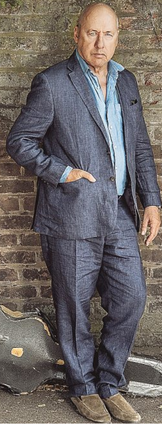
Die Dire-Straits-Legende kommt mit neuem Album