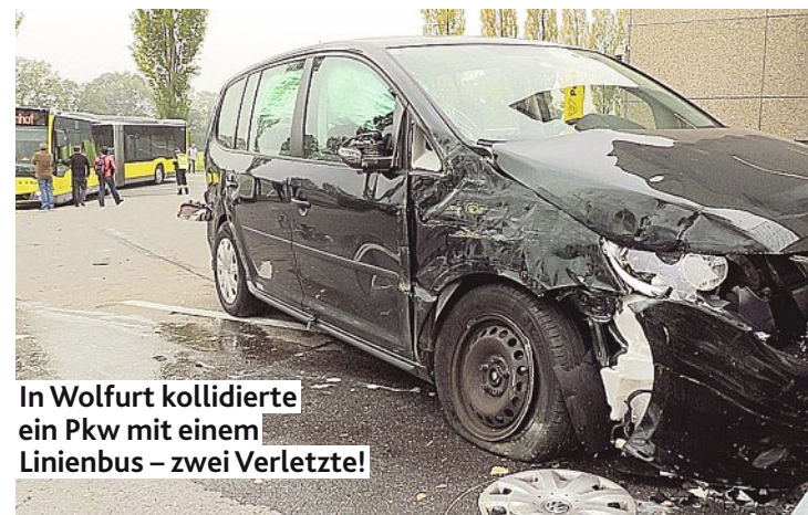
In Wolfurt kollidierte ein Pkw mit einem Linienbus – zwei Verletzte!

Irres Überholmanöver fordert zwei Verletzte